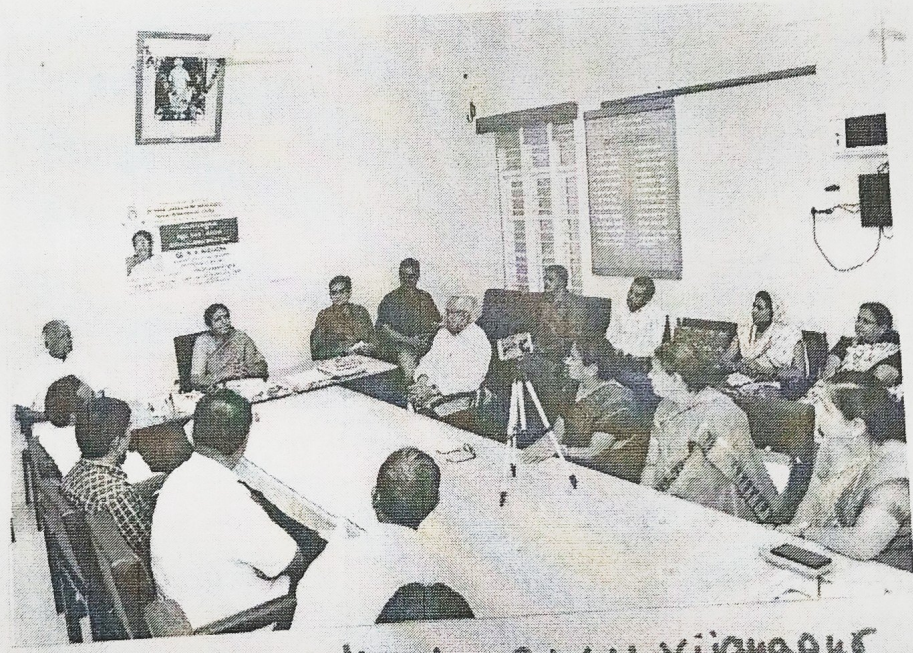
Vice-chancellor, K.S.A.W.U. Vijayapur addressing management and staff

PRINCIPAL S. V. M. Arts & Commerce College for Women, ILKAL